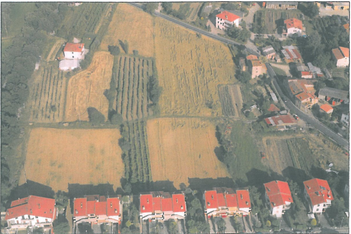
IMMAGINE AEREA, con a monte la Lottizzazione La Ginestra e a valle la Lottizzazione Montedoglio