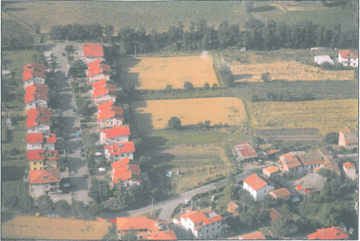
IMMAGINE AEREA, con a monte la Lottizzazione La Ginestra e a valle la Lottizzazione Montedoglio