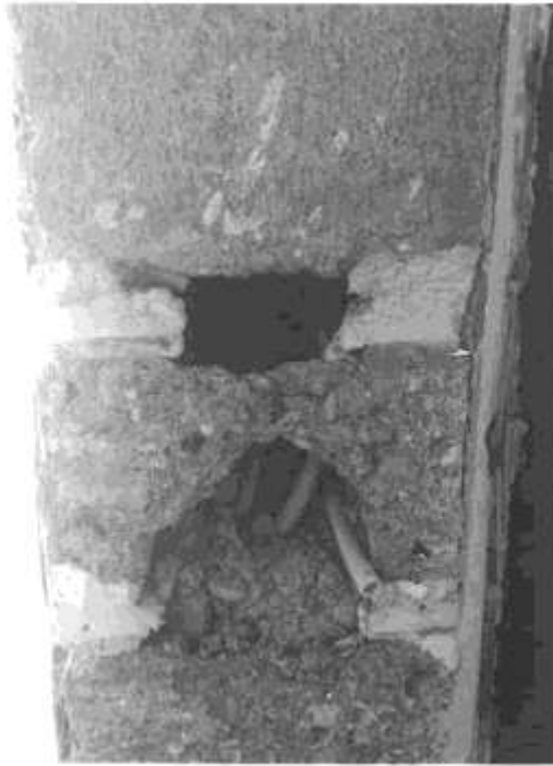
Foto 1 - Muro di spina in blocchi/cassero cemento vuoti (interno).