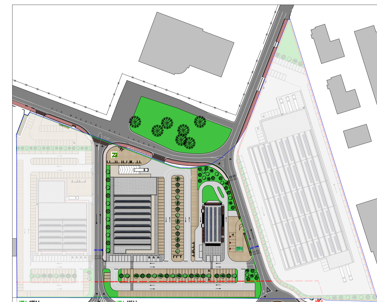
PLANIMETRIA CON RIFERIMENTI UMI ED AREE UMI 1 - AREA 2